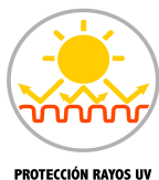
PROTECCIÓN RAYOS UV

Se recomienda NO almacenar expuesto a intemperie y/o a temperatura mayor a los 35° C